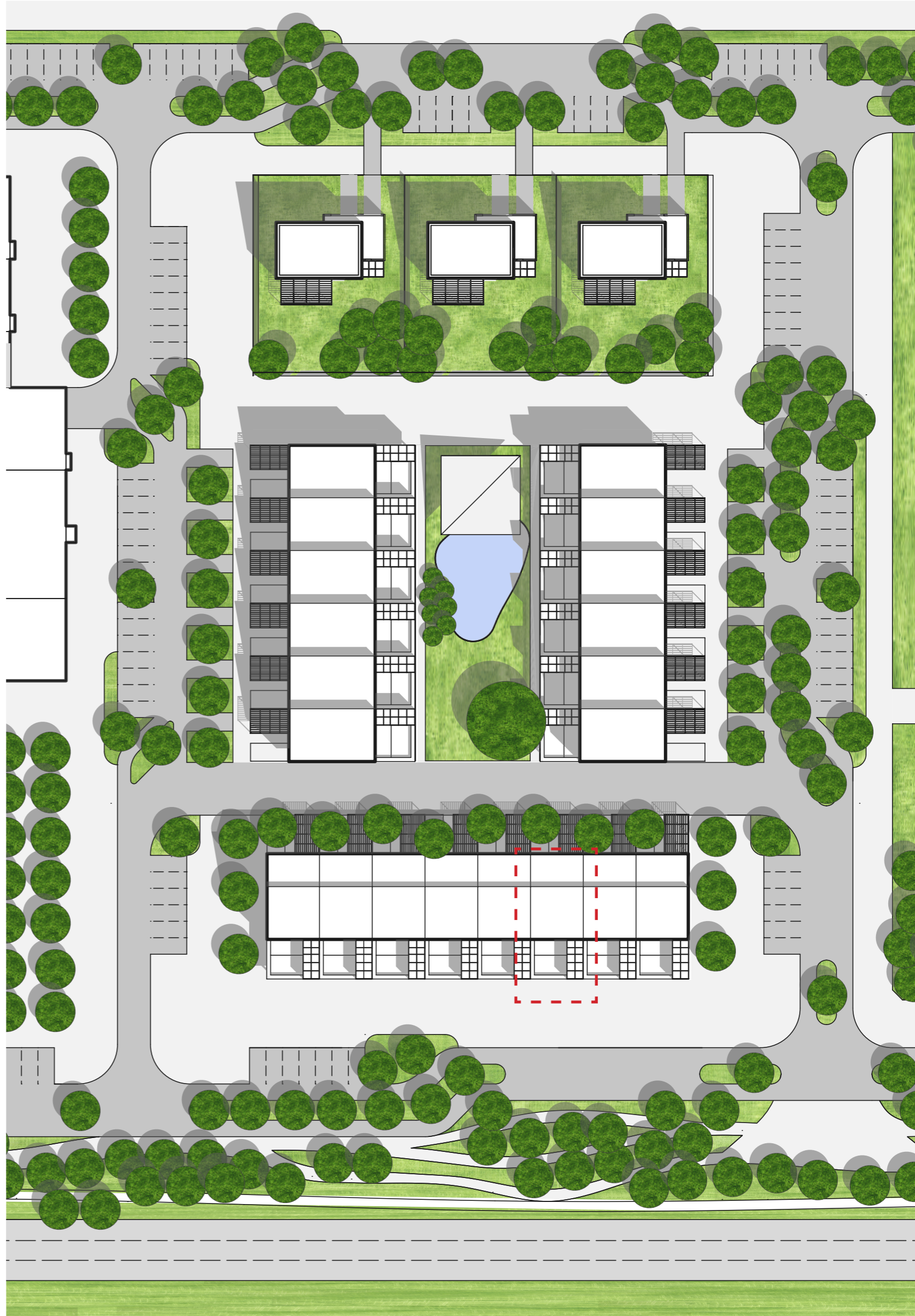
SITUACE - SEVERNÍ POZEMEK 1:1000