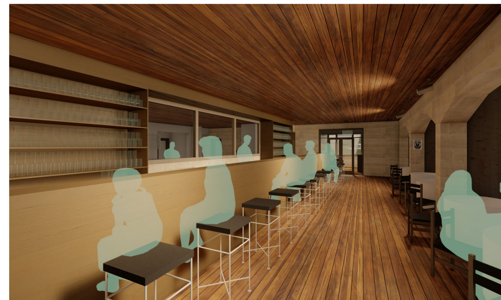
POHLED NA RESTAURACNÍ BAR