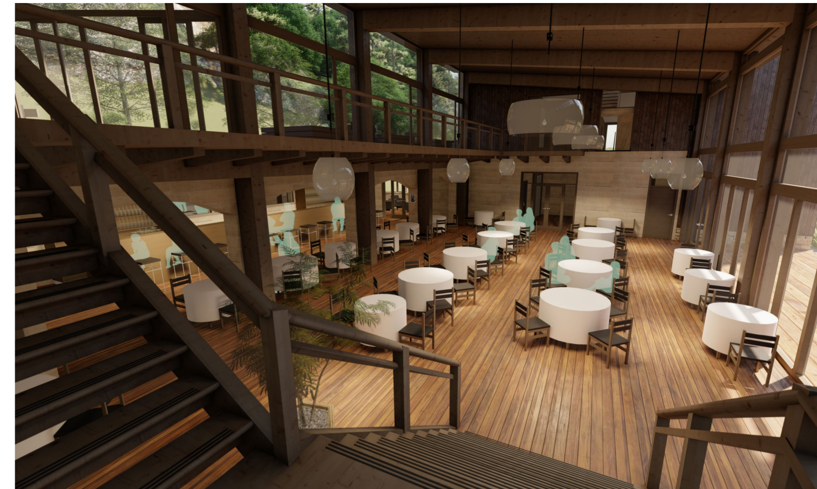
POHLED NA RESTAURACI