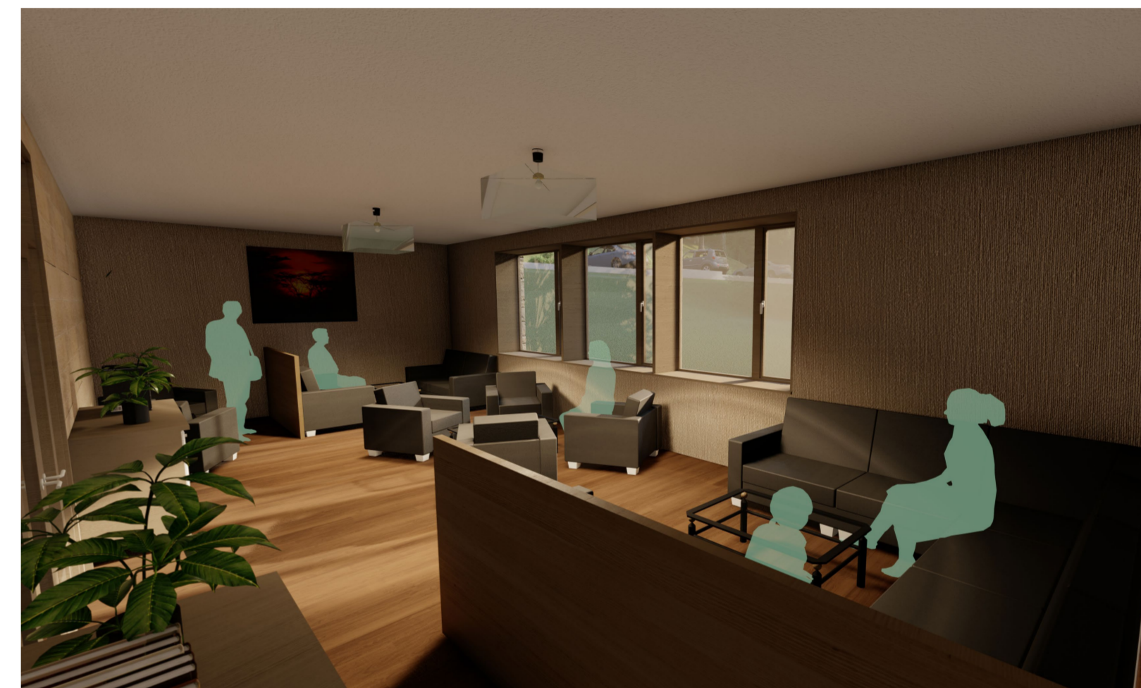
POHLED NA SALONEK