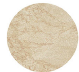
1. Střešní krytina dvouvrstvý obklad umělý kámen Travertino Navoma