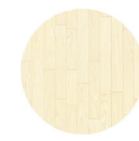
4. Dřevěné obložení stěn ze světlého dřeva