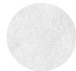
2. Pohledový beton