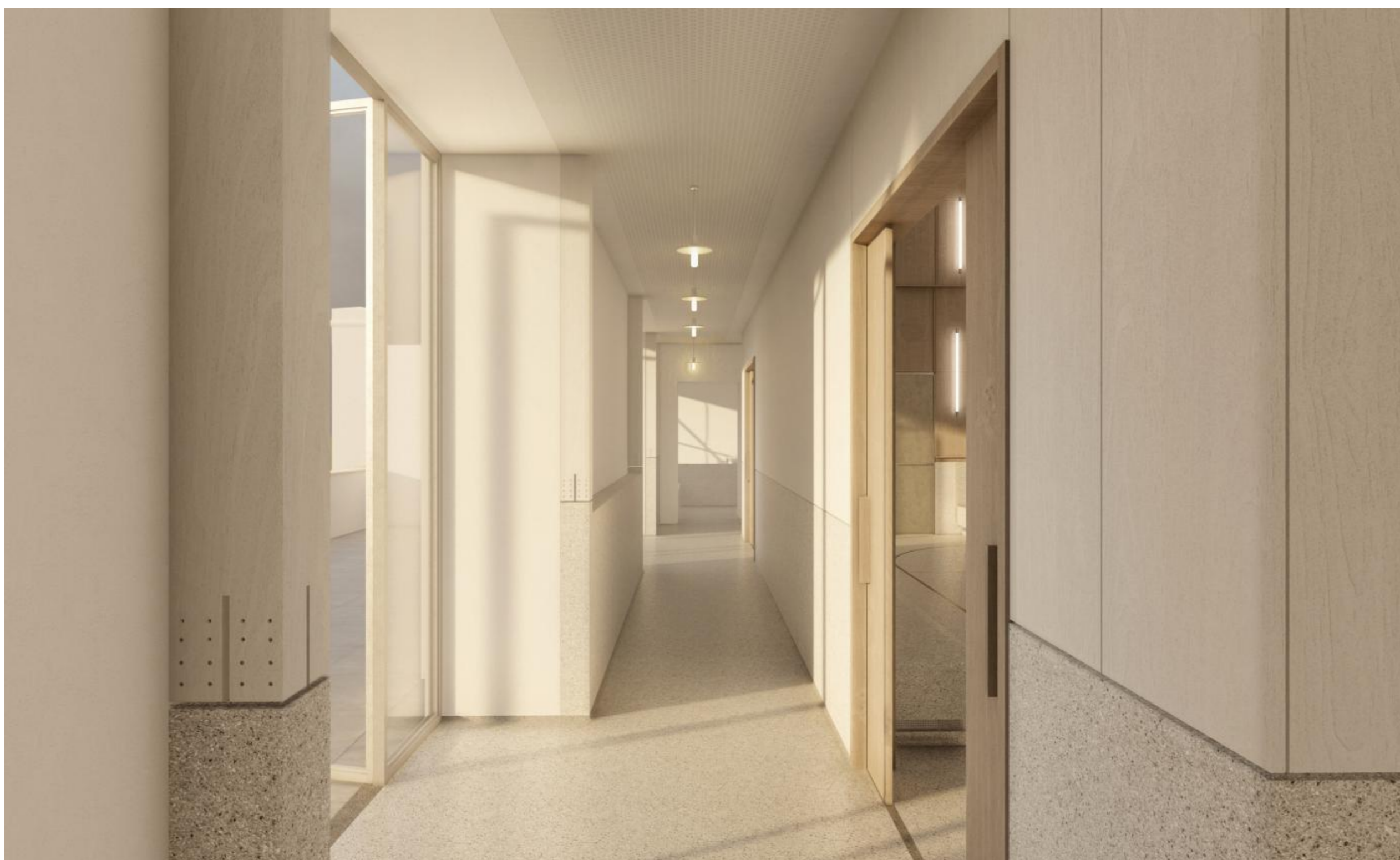
spojovací ochoz dvou křídel budovy