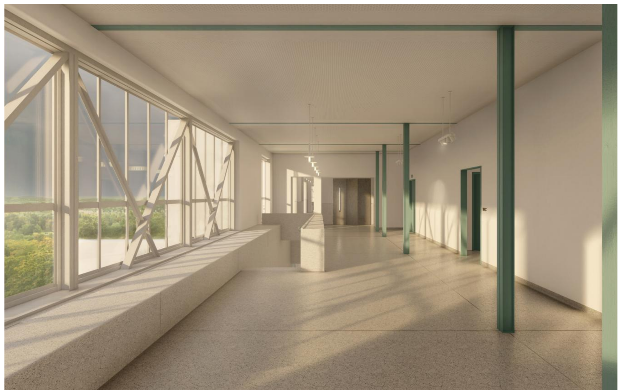
foyer a vstup do auly