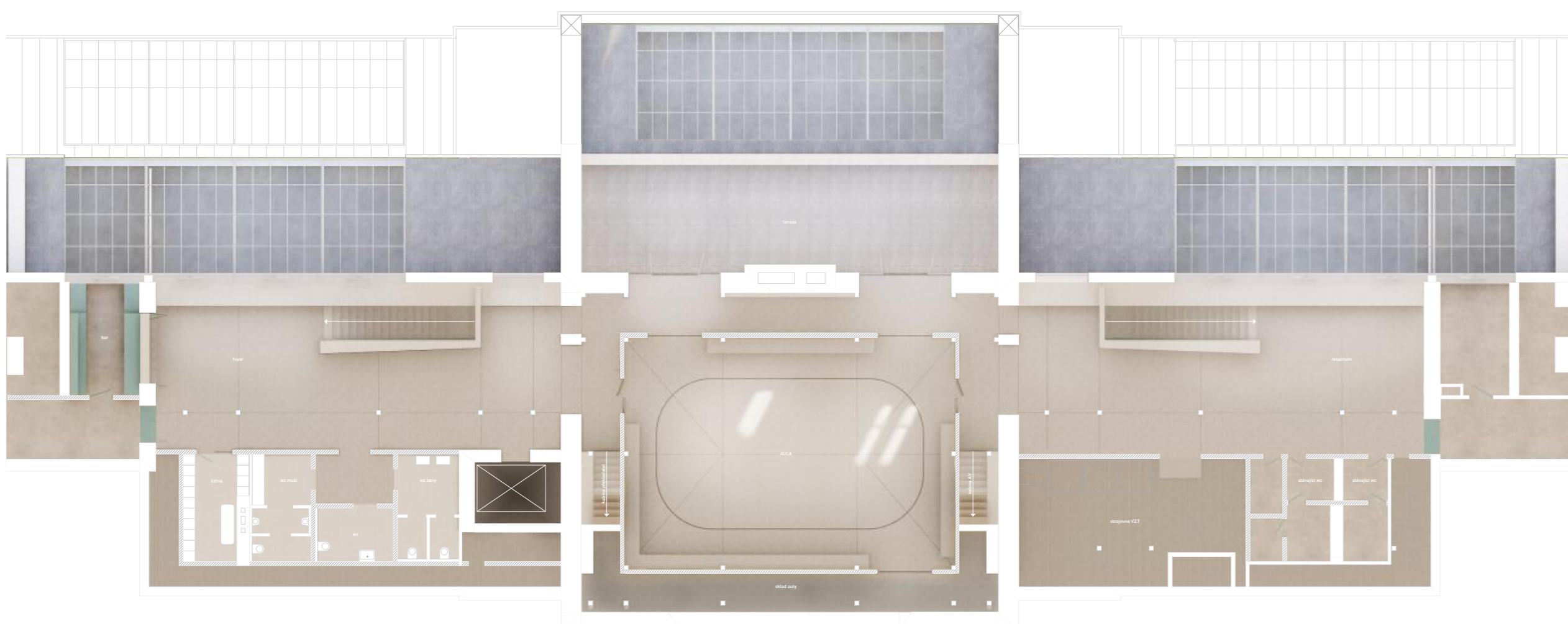
půdorys auly v III.NP