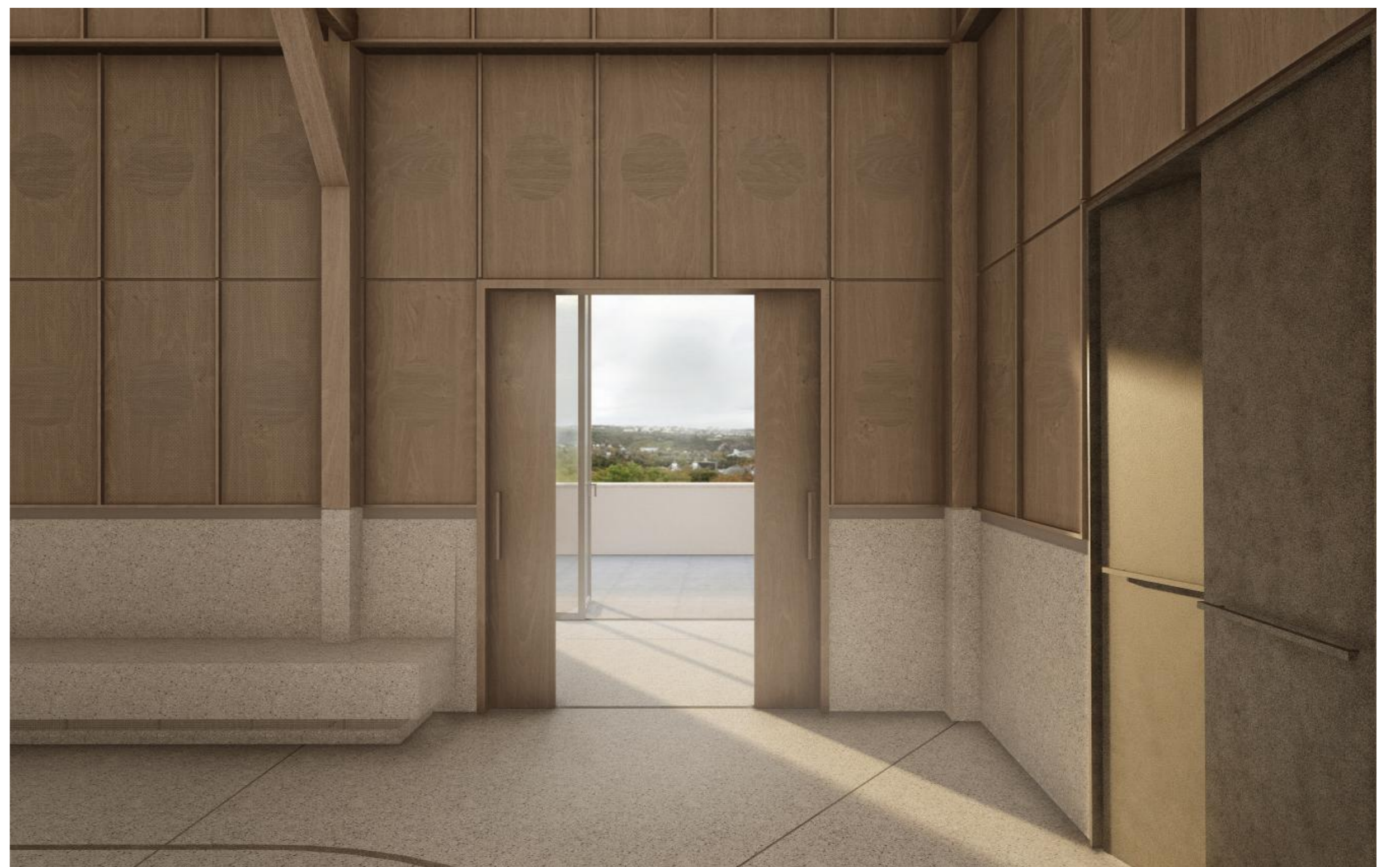
vstup na terasu