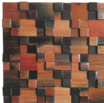
Item: SHW-3122 Size: 30*30*1,2cm