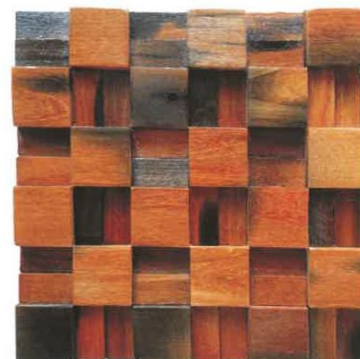
Item: SHW-3263 Size: 30*30*2cm